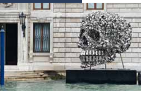
Subodh Gupta, The Very Hungry God , 2006

Nu ja, begrijp me niet verkeerd. Ik wil hier geen romanticus zijn die overtuigd is van het feit dat een kunstwerk alleen, zonder de hulp van galerijhouders, critici, verzamelaars, museum- en kunstmarktspecialisten en tot slot de kunstenaars zelf, in de kortste tijd wereldroem kan bereiken. Nee, nee en nog