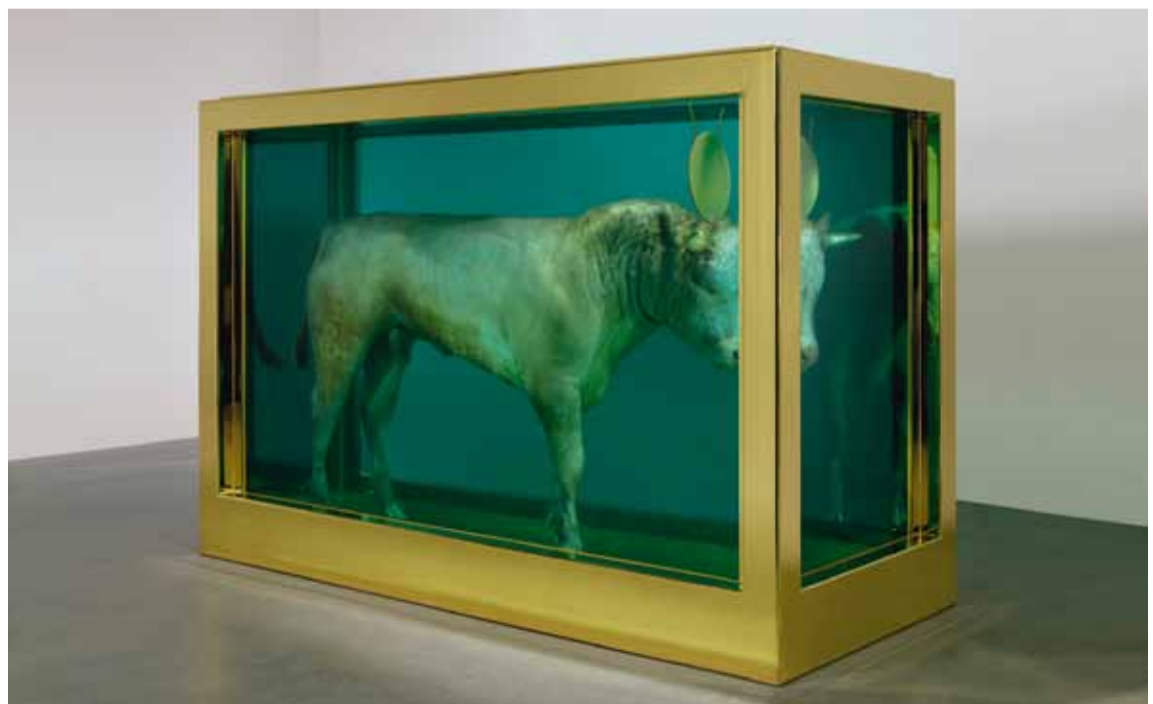
Damien Hirst, The Golden Calf, 2008, kalf, 18 karaats goud, glas, verguld staal, silicone, formaldehydeoplossing, sokkel in Carraramarmer, 215 x 320 x 137 cm

Tot slot wou ik zelf toch weten wanneer haar boek "Art Business 3" zou verschijnen. "Naar alle waarschijnlijkheid in 2016", was het voorzichtige antwoord en dus, laten we hopen, na de huidige crisis. In afwachting is haar boek dat nu op de toonbank ligt een aanrader en dus ook het lezen meer dan waard.