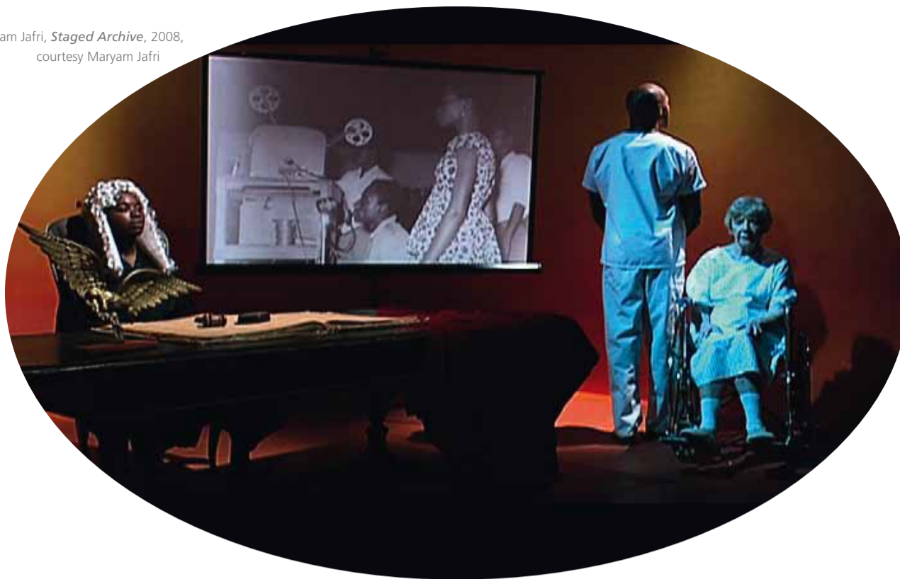
Maryam Jafri, Staged Archive , 2008, courtesy Maryam Jafri

Contour maakt ondertussen deel uit van een Europees netwerk van instellingen en festivals die focussen op bewegend beeld. Met nu al partners in Milaan, Osnabrück, Linz, Clermont-Ferrand, Wrocław en Vilnius wordt de actieradius veel breder, zodat kunstwerken een Europese rondreis kunnen maken.