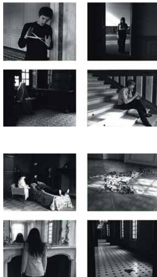
Ulla von Brandenburg, 8 , 2007, courtesy Art: Concept, Parijs

Hoe wordt de geschiedenis geschreven? Wie schrijft geschiedenis? Contour 2009 verdedigt het belang van geschiedenis in onze tijd van vlug vergeten. Om Eric Hobsbawm, een van de grootste actuele historici, te citeren: "Alleen de geschiedenis kan ons helpen om een richting te vinden. Wie zonder de geschiedenis naar de toekomst kijkt, is niet alleen blind. Hij/zij speelt een gevaarlijk spel, zeker in deze hoogtechnologische tijden." Een afdoende kennis van de geschiedenis – of liever, van 'geschiedenissen' – is van groot belang om sociale en culturele processen te begrijpen.