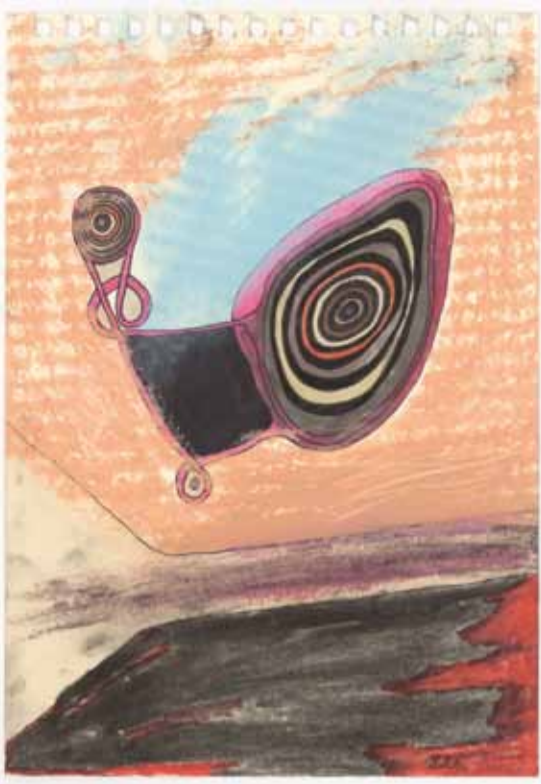
Anne-Mie Van Kerckhoven, Friedrichstrasse , 2006, inkt, verf en kleurpotlood op papier, 20,5 x 14,5 cm