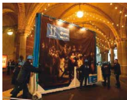
Laat uw kunstvoorwerpen ophangen door een vakman.

Controleer alle sloten, zorg voor sloten op alle bereikbare ramen en voor 5-puntsnachtsloten op buitendeuren. Zorg dat uw kostbaarheden niet van buiten het huis zichtbaar zijn en dat ze niet door kortstondige bezoekers zoals verkopers worden gezien. Overweeg uw kostbaarheden in een safe, in afgesloten kasten of in de bank op te slaan wanneer u met vakantie gaat. Om uw kostbaarheden op te kunnen sporen als ze worden gestolen, dient u er foto's van te maken en ze zo mogelijk met een ultraviolette pen te markeren.