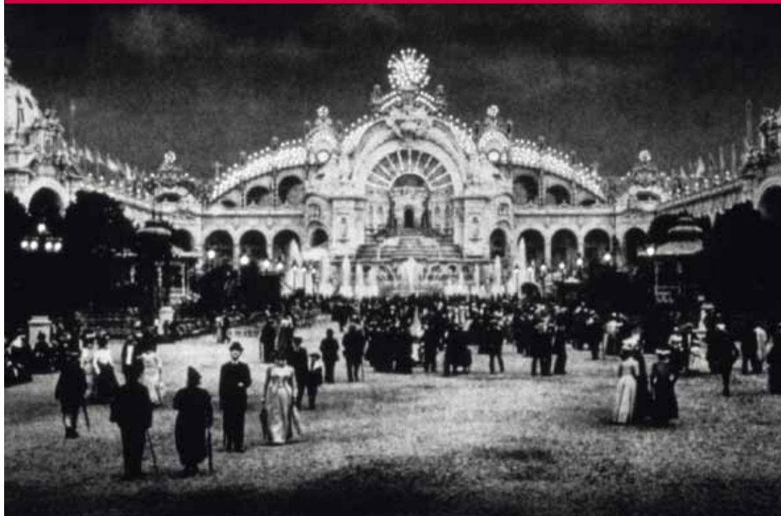
Andreas Bunte, La Fée Electricité , 2007