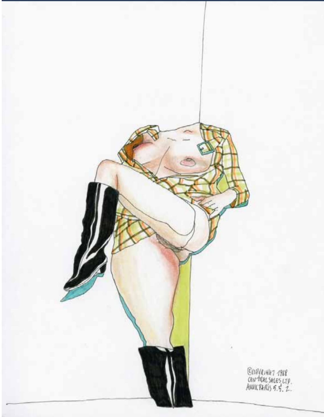
Anne-Mie Van Kerckhoven, Untitled , 2002, inkt, pastel, viltstift op papier, 26,3 x 20,6 cm, courtesy Zeno X Gallery, Antwerpen