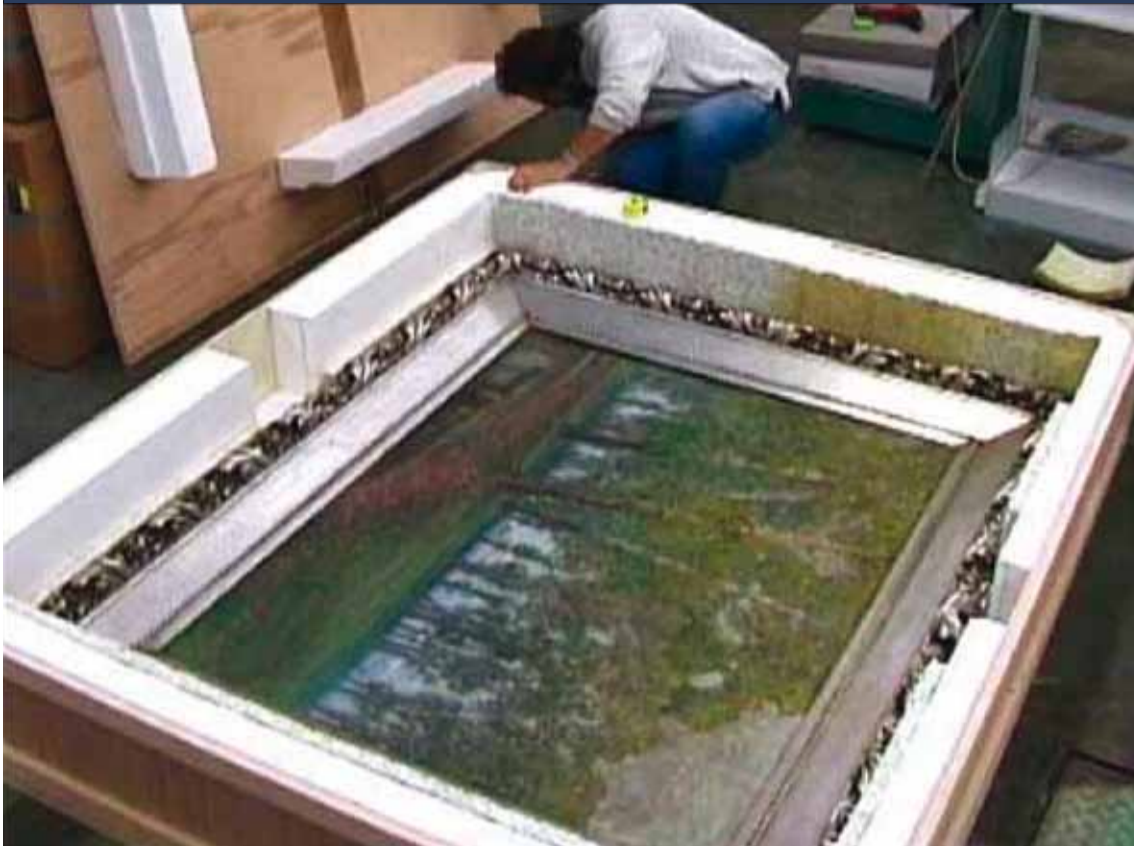
Een goede verzekeringspolis dekt het transportrisico. Idealiter moet elk kunstwerk apart worden ingekist.