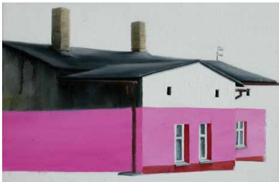
Slawomir Elsner, o.T. ( Haus Nr.52 ), 2005, oil on canvas, 30 x 40 cm