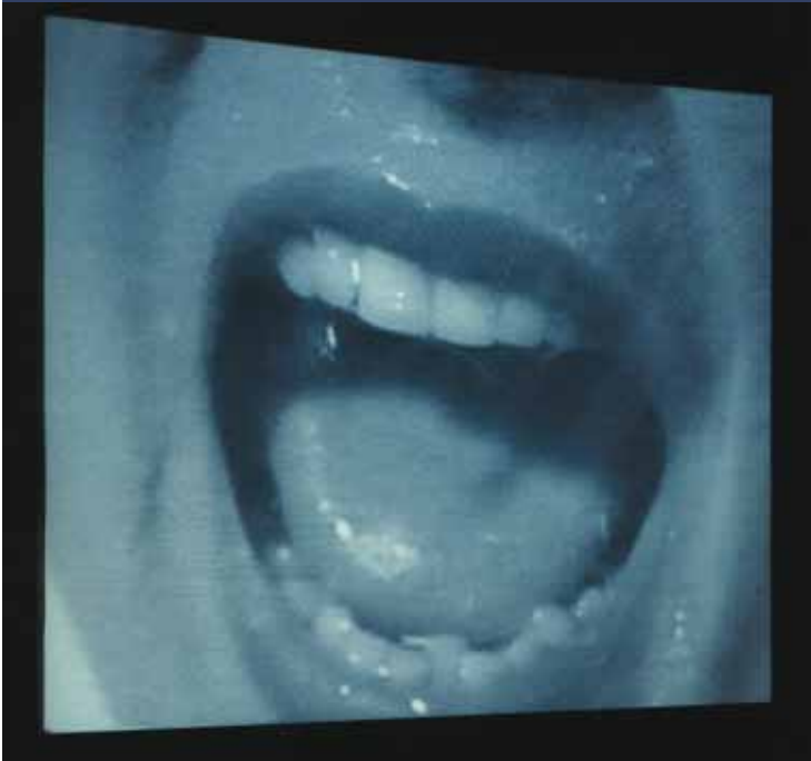
Douglas Gordon, 24 Hour Psycho , 1993