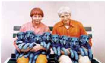
Jeff Koons, A String of Puppies , 1974

Gaat het duidelijk om een reproductie, dan kunnen nog uitzonderingen op het auteursrecht worden ingeroepen. De wet op het auteursrecht bepaalt namelijk verschillende gevallen waarin een bestaand werk mag gebruikt worden. Twee daarvan – citaat en parodie – zijn van toepassing bij toe-eigeningskunst.