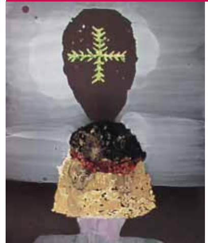
Bernd Imminger, Aus Einem Guss , 2005, lacquer, pigment, gold leaf on wood, 90 x 75 cm, courtesy Stéphanie Bender, wandergalerie, Munich