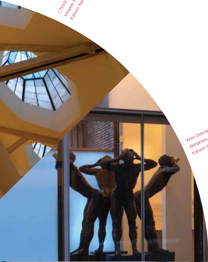
Wim Delvoye, Windroos, 1992, Katoen Natie, Antwerpen