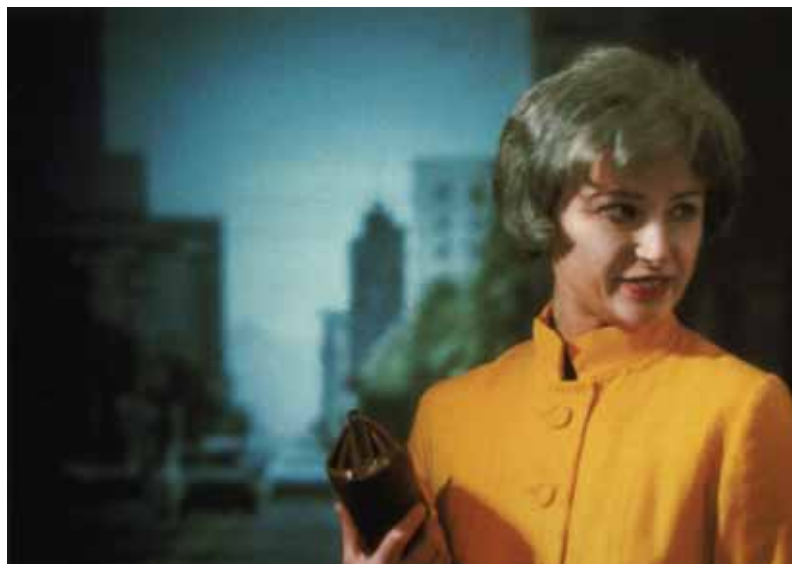
Cindy Sherman, Untitled #74 , 1980

In een parodie mogen zelfs werken gebruikt worden die door het auteursrecht beschermd zijn. Ook daar is het echter niet zo makkelijk om via een beroep op die wettelijke uitzondering een toe-eigeningskunstwerk van vervolging te