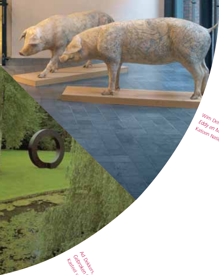
Ad Dekkers, Gebroken Cijfel, 1971, Kasteel van Wijlre