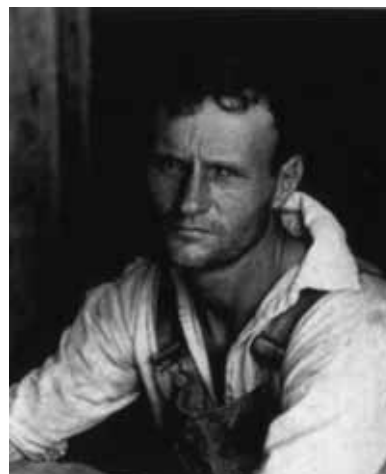
Sherrie Levine, After Walker Evans , 1981