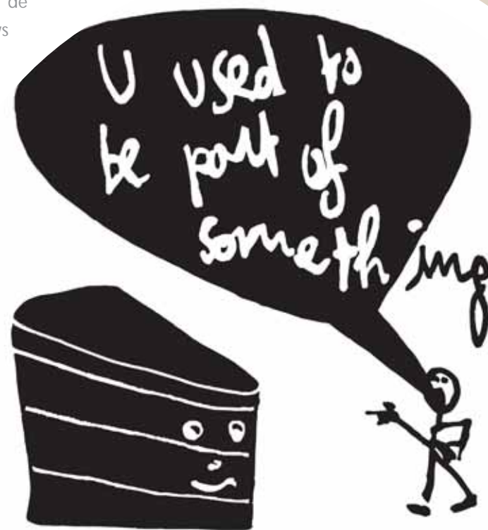
Vaast Colson, You used to be part of something , 2005, © Vaast Colson, courtesy Maes & Matthys Gallery, Antwerpen

Grote Markt 50, 8500 Kortrijk, 056 232 351 van maandag tot vrijdag van 9 tot 12.30 uur en van 13.45 tot 16.30 uur, op zaterdag van 9.30 tot 12 uur, gesloten op zon- en feestdagen en bankholidays, uitzonderlijk open op zondagen 18 februari, 25 maart en 22 april 2007, van 14 tot 17 uur.