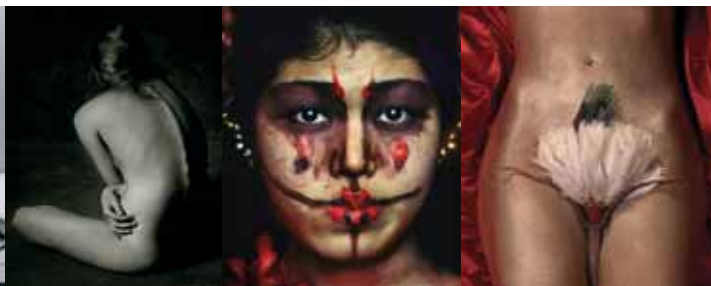
10 11 12