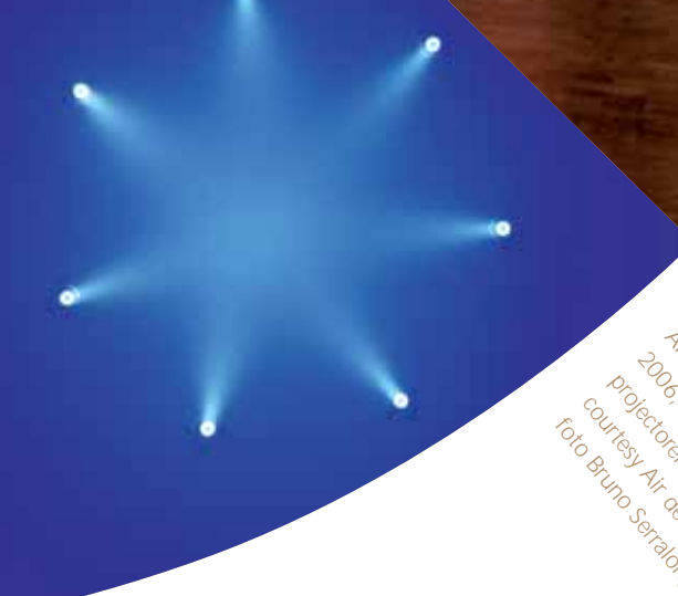
Ann Veronica Janssens, Bluette , 2006, PAR en blauwe Optiled- projectoren, artificiële mist, courtesy Air de Paris, foto Bruno Serralongue