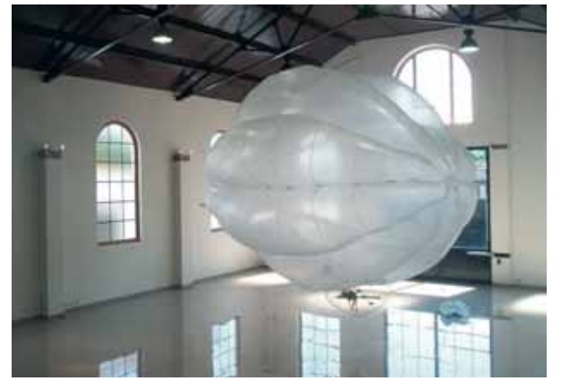
Panamarenko, Papaver, 2002