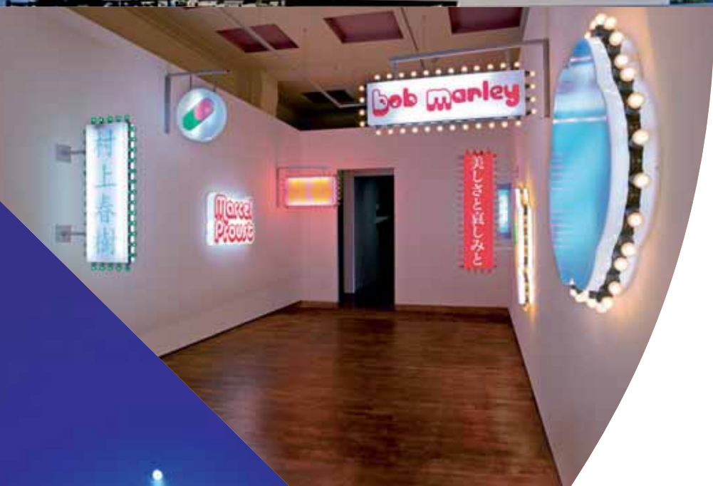
Hsia-Fei Chang, Urmqi , 2006, uithangborden, neon- en kleurlampen, metaal