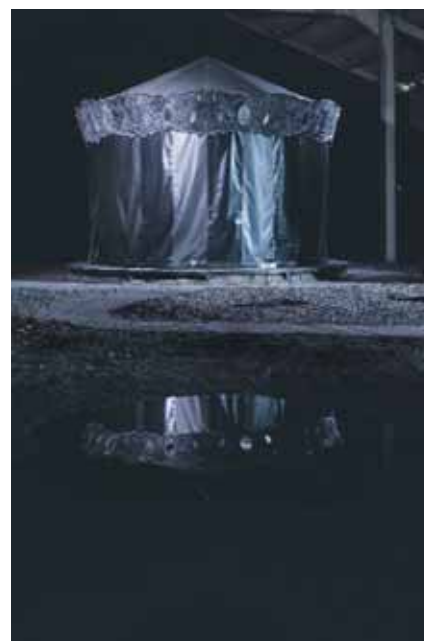
Hans Op de Beeck, Merry-Go-Round , sculptuur-installatie, 2005

Als naar gewoonte sloten we deze bijeenkomst af rond een glas champagne en enkele hapjes. Restaurant Pegasus, een aanrader in het leperse, was voor onze opgetogen leden het perfecte kader om geanimeerd na te praten over de voorbije dag.