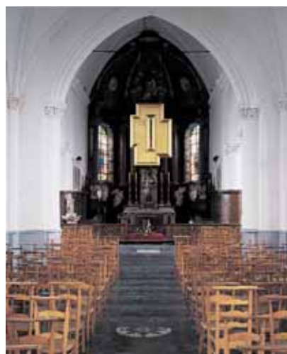
Christian Eckart, Icon , 1989, © Dirk Pauwels

De kerk en het kerkhof van het dorp maken deel uit van de festivalruimte. Meteen worden we eraan herinnerd dat het thema van de overgang van leven naar dood in het oeuvre van heel wat kunstenaars en dichters een centrale plaats inneemt. Op deze 'plek van geloof' wordt het verschijnen-en-verdwijnen van het geschreven gedicht helemaal omvat door het licht van een vergulde Icon van Christian Eckart.