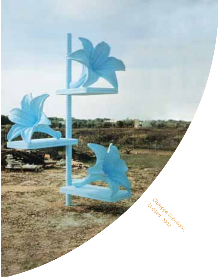
Giuseppe Gabellone, Untitled, 2002

Over een periode van vijf jaar koopt Groeninge zowat 35 werken aan. Een beheerraad van acht leden neemt de uiteindelijke beslissing. Financieel rendement is niet de drijfveer om toe te treden tot Groeninge, maar geld is toch geen onbelangrijke factor voor de samenhang binnen de groep.