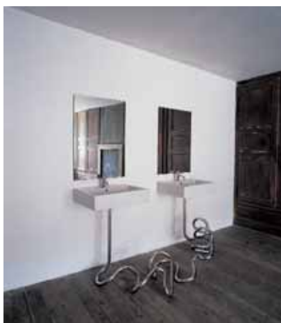
Elmgreen and Dragset, Marriage, 2004