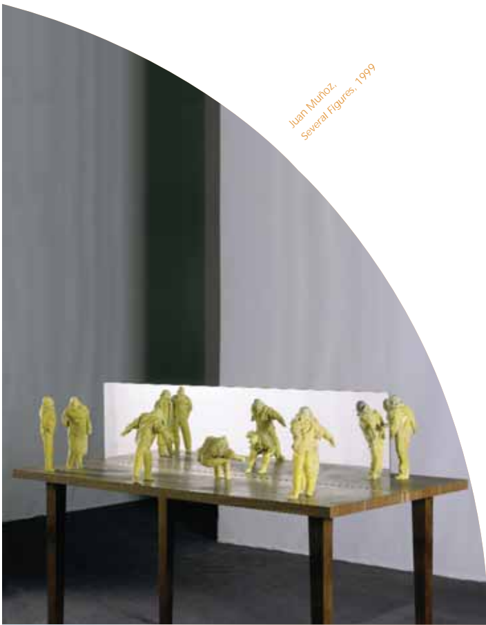
Juan Muñoz, Several Figures, 1999