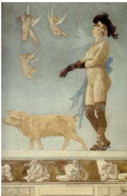
Félicien Rops, Pornocratès , 1878

We kunnen hier niet alle denkbeeldige situaties op een rijtje zetten. Ik stel voor dat we een voorbeeld nemen. Ik ben eigenaar van een schilderij van een anonieme zeventiende-eeuwse kunstenaar en ik wil dat werk uitvoeren naar Genève. Eerste vraag die ik mij moet stellen: is mijn schilderij een 'cultureel goed'? Ik kijk dus naar wat Europa erover zegt en stel vast dat schilderijen die volledig met de hand tot stand zijn