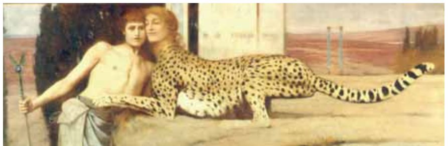
Fernand Khopff, Les Caresses , 1896

gekomen, op eender welke drager en met gelijk welke grondstof, die meer dan vijftig jaar oud zijn en niet meer in het bezit van degene die ze gemaakt heeft, als culturele goederen kunnen beschouwd worden. Mijn schilderij is meer dan vijftig jaar oud en ik heb het niet zelf vervaardigd. Rest mij nog na te gaan hoeveel het waard is en dat bedrag te vergelijken met de drempel die is vastgelegd voor schilderijen, namelijk 150.000 euro. Is mijn schilderij meer waard, dan heb ik een toelating nodig. Is het minder waard, dan stuur ik het naar Zwitserland zonder mij nog verdere vragen te stellen.