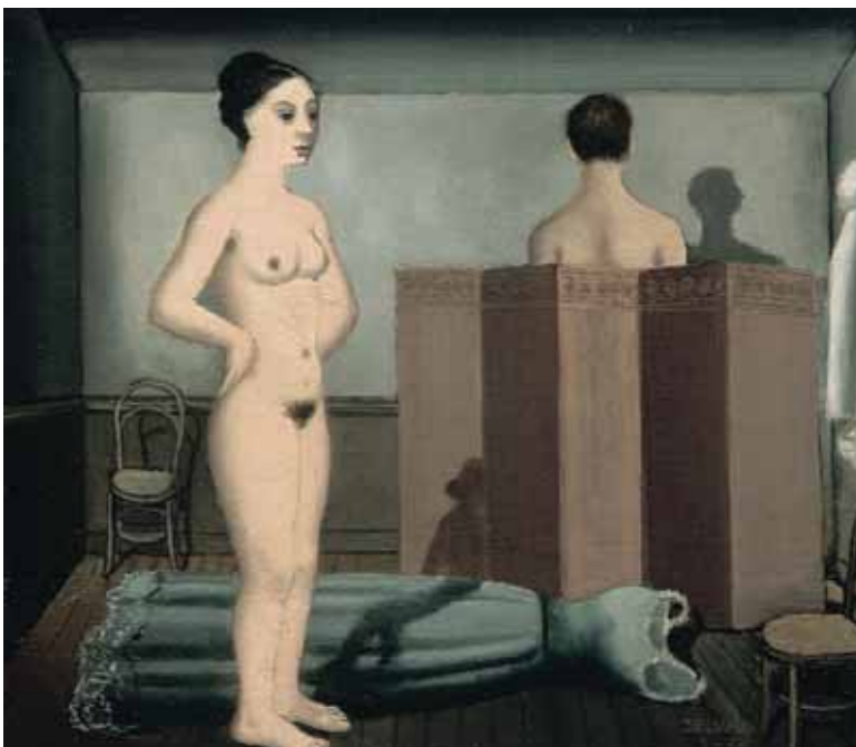
Delvaux, Het Scherm , 1935, oil on canvas, © Stichting Paul Delvaux, Sint-Idesbald, Belgium

Woont u in Brussel, dan geldt het principe van de vrije circulatie van goederen zonder beperking, althans zolang er geen samenwerkingsakkoord is tussen de Gemeenschappen en een federale wet de zaak niet geregeld heeft. Ook de Duitstalige Gemeenschap heeft op dat vlak nog geen regels uitgewerkt en dus bestaat daar geen enkele beperking op het verzenden van een kunstwerk dat in privé-bezit is.