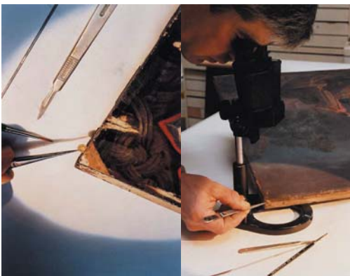
1. 2. Het inbrengen van een elektronische chip is een efficiënt identificatiemiddel

Al die elementen maken het er alleen maar moeilijker op, gezien de aard van de informatie. Bij gebrek aan gecodeerde en gedigitaliseerde gegevens hebben de politiediensten gemiddeld drie maanden nodig om een onderzoek in te stellen en de informatie te doen circuleren. Volgens de Belgische Federale Politie wordt slechts 7 % van de 12.000 jaarlijks (aangegeven) gestolen kunstwerken teruggevonden! En een nog verbazender vaststelling: slechts de helft daarvan wordt uiteindelijk teruggegeven aan de eigenaar, omdat het verband niet wettelijk bewezen kan worden. Het Burgerlijk Wetboek bepaalt immers: "Met betrekking tot roerende goederen geldt het bezit als titel (art. 2279 al.1)". De eigenaar moet dus bewijzen dat het goed in kwestie van hem is. Dat valt niet mee, want vaak zijn de elementen die de kunstverzamelaar aanbrengt, niet verzoenbaar met de standaarden die de inlichtingendiensten hanteren: lange en ingewikkelde