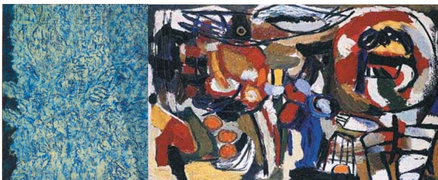
Max Ernst, Arizona-landschap in de lente, circa 1948