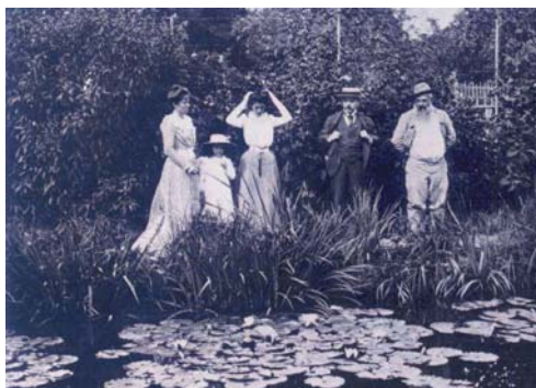
Fotografie in Giverny, met Monet aan de rechterzijde, in gezelschap van de familie Durand-Ruel

Renoir, een van zijn intiemste vrienden, schrijft hem: " Laat ze [het publiek, de