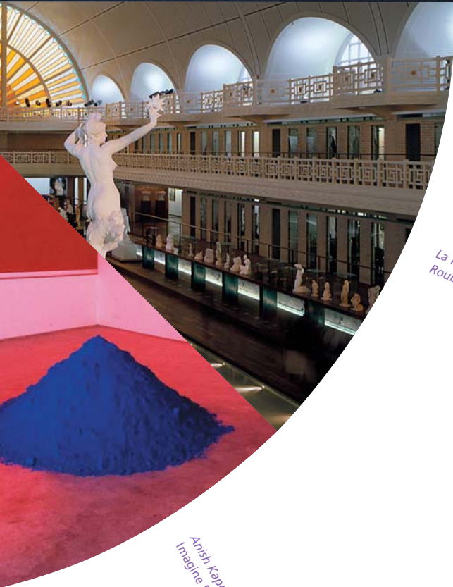
La Piscine, Roubaix