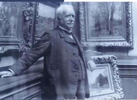
Paul Durand-Ruel in zijn galerij circa 1910 op een leeftijd van 80 jaar