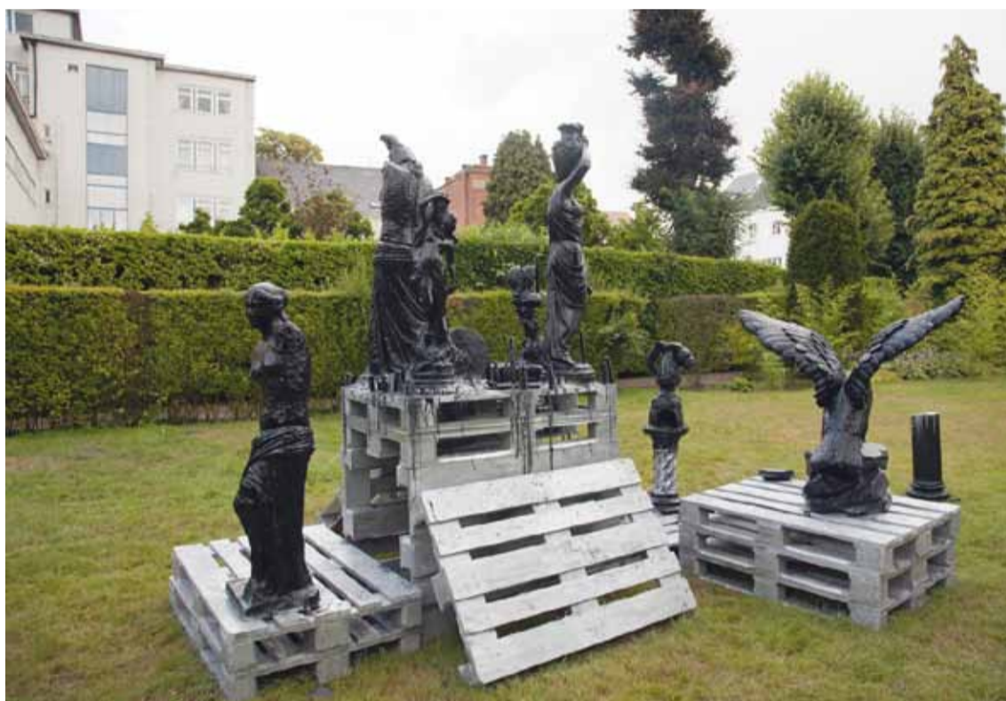
Marc Bijl, Desintegration