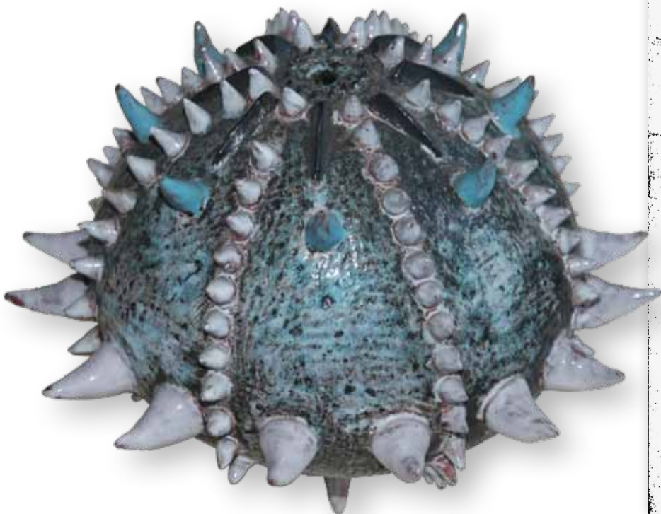
Francis Dufey, zeeëgel, keramiek, (KMKG, NIG 9524)

5. De bibliografie: de lijst met publicaties en tentoonstellingscatalogi waarin het werk wordt besproken, afgebeeld of vermeld.