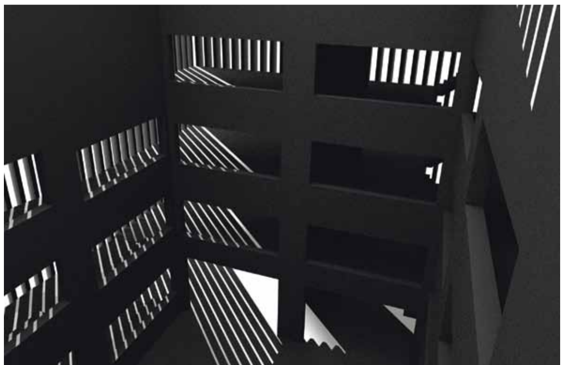
Anouk De Clercq, Building , 2003

In 2007 werd de foto H.S.-N.Y.-94-99 van Dirk Braeckman gekocht. De close-up van decoratief behangpapier werd geprint op Japans zijdepapier, in hars gedrenkt en tegen de nok van het Atrium gekleefd. Van beneden leiden betonconstructies onze blik naar boven, waar we een monumentaal vlak van grijstinten zien dat door de architectuur bijna letterlijk wordt ingekaderd. Boven verleiden pixels, licht- en schaduwzones en de delicate textuur van de drager tot een langzame, haast tactiele verkenning van het beeld. Doorheen een donkere waas ontdekken we ouderdomssporen (een gat, een bultje, een vlek, een streep) die de foto picturale kwaliteit verlenen. De wand lijkt het werk wel te hebben opgezogen. Als een muurschildering, zo naadloos maakt het deel uit van het gebouw. Met de reflectie