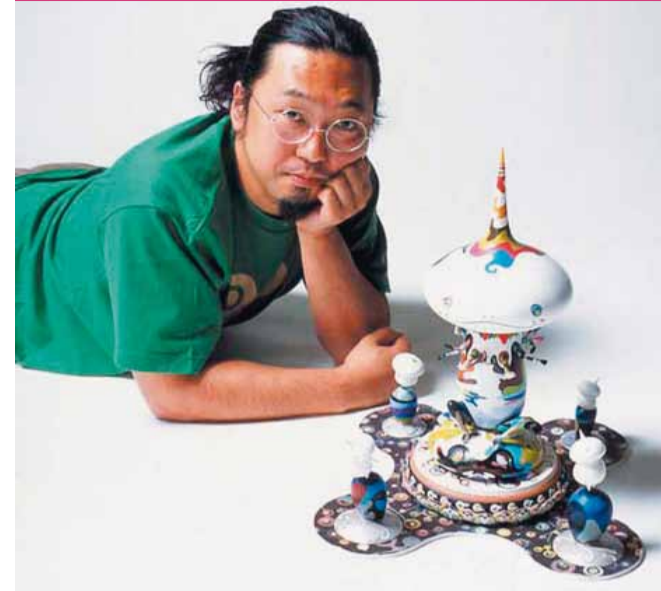
Portret van Takashi Murakami