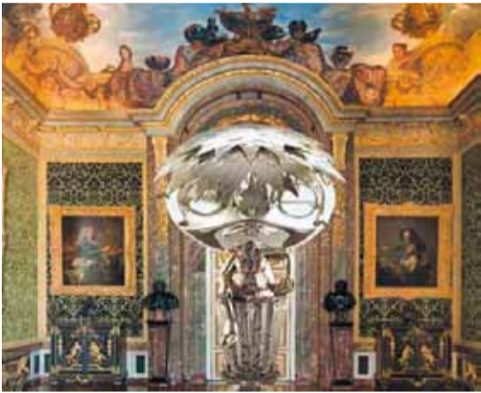
Takashi Murakami, Oval Buddha Silver, 2008, courtesy Blum & Poe, © Takashi Murakami / Kaikai Kiki Co. Ltd., Kasteel van Versailles, Salon van de overvloed

De getalenteerde Murakami scheidt in zijn kunst een nieuwe beeldtaal. Hij put inspiratie uit Japanse tradities, mangastrips en alle vormen van popcultuur. Zijn werken zijn een uiting van een vluchtig moment van uitbundigheid, zoals de feesten van Lodewijk XIV. We herontdekken Versailles als een "plaats voor experimenten" en een multidisciplinair "laboratorium" voor de meest gewaagde creaties. Het was een cultuurschok die de liefhebbers van hedendaagse kunst onder ons wist te bekoren. Het monumentale, tussen twee bassins opgestelde standbeeld van de kunstenaar bracht zelfs een heus debat op gang.