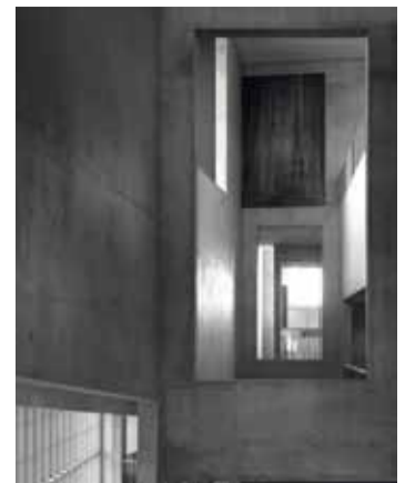
Dirk Braeckman, H.S.-N.Y.-94-99 , 2007, © Kristien Daem

van de flits benadrukt de fotograaf dat zijn beelden onvermijdelijk subjectief zijn. Net in dat wat de meesten banaal vinden, ontdekt zijn intuïtieve kijk betekenis. Zo wordt dit pompeuze behangmotief binnen zijn nieuwe context sober en krijgt het zin als monumentaal ornament in een zo goed als ornamentloos gebouw.