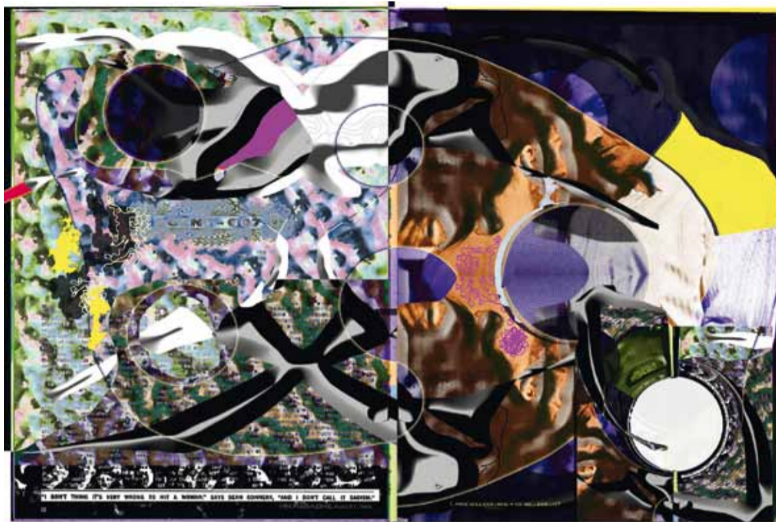
Anne-Mie Van Kerckhoven, Goldfinger , courtesy Zeno X Gallery