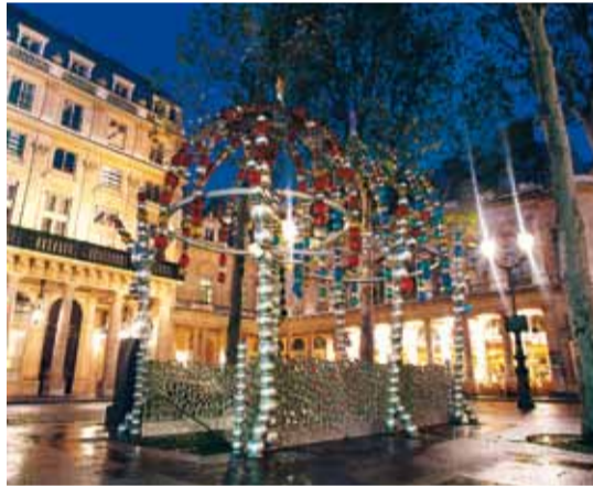
Jean-Michel Othoniel, Le Kiosque des Noctambules , 2000