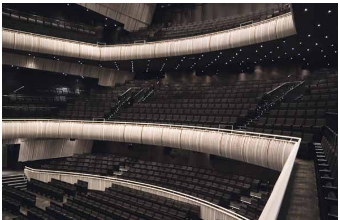
Balkons van de concertzaal

December Dance10 geniet de steun van het Belgische voorzitterschap van de Raad van de Europese Unie.