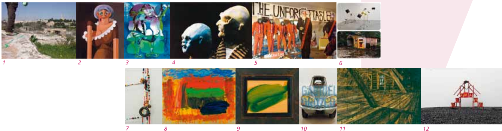
1 Francis Alÿs, The Green Line , 2004, video

Art Basel Miami Beach Miami, 2 tot 5 december 2010 www.artbaselmiamibeach.com