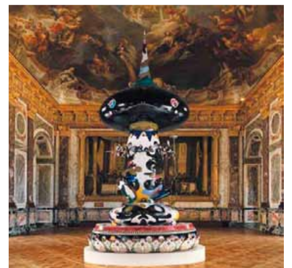
Takashi Murakami, Tongari-Kun, 2003-2004, © Takashi Murakami / Kaikai Kiki Co. Ltd., Kasteel van Versailles, Salon van Hercules