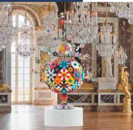
Takashi Murakami, Flower Matango , 2001 – 2006, © Takashi Murakami / Kaikai Kiki Co. Ltd., Kasteel van Versailles, Galerie des Glaces, foto: Florian Kleinfenn