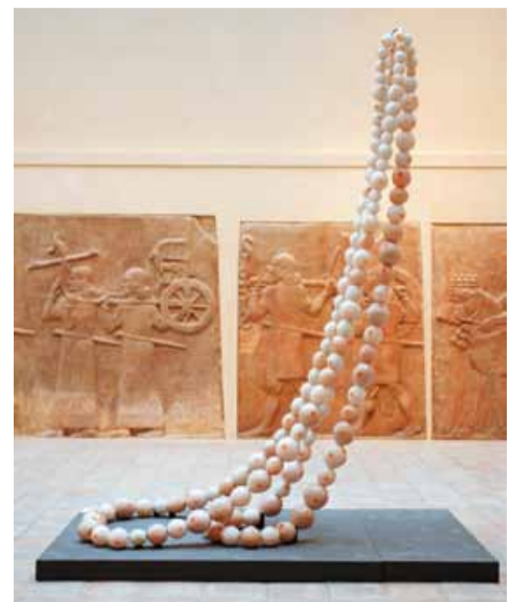
Jean-Michel Othoniel, La Rivière blanche , het Louvre, 2004

Stilaan wordt het tijd om te vertrekken en terwijl er nog enthousiast wordt nagepraat bij een glas nemen we afscheid van onze gastheer. Het was een uitstap die we ons zullen blijven herinneren als een verrijkende en boeiende dag vol kunst.