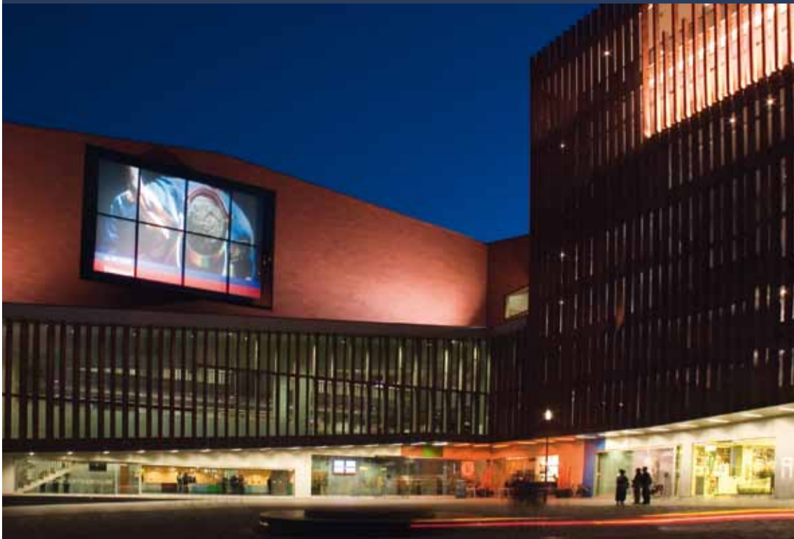
Voorgevel van het Concertgebouw Brugge