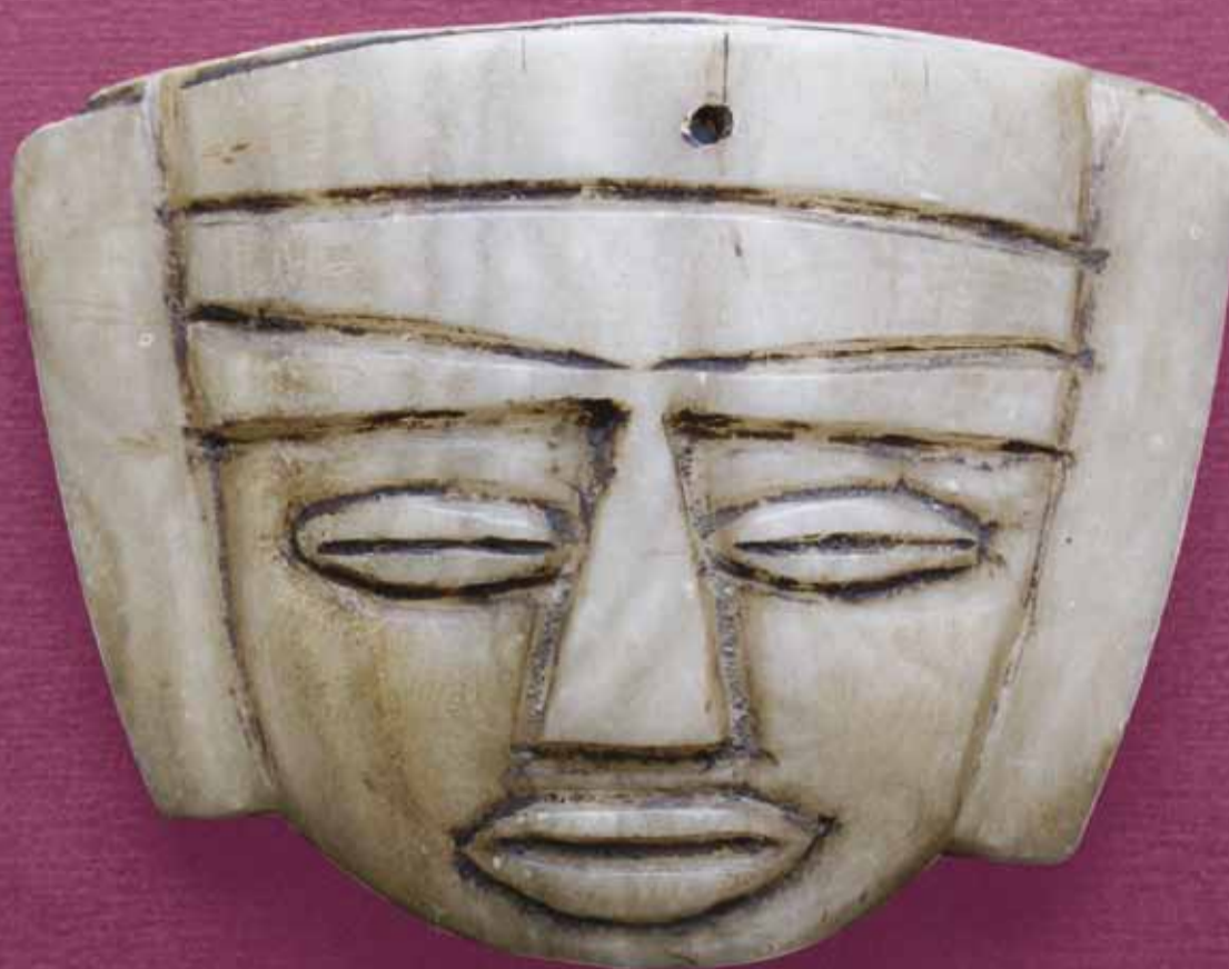
Klein menselijk Azteeks masker (KMKG, inv. AAM 46.8.11)