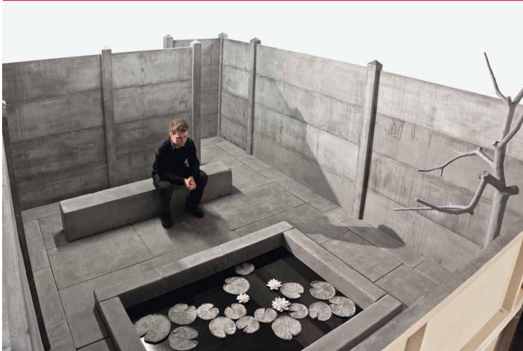
Hans Op de Beeck, Secret Garden