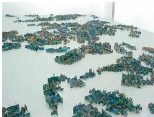
Hendrikje Kühne & Beat Klein, A World of Difference , 2001, foto's uit reisbrochures op karton, 200 m 2

van de wereld maakte plaats voor een driedimensionale installatie van 200m 2 waarin de oppervlakte van een land bepaald werd door het aantal toeristische afbeeldingen die de kunstenaars ervan hadden gevonden. Zodoende herdefinieerden Kühne & Klein de wereld. Elke regio wordt weergegeven zoals ze ook in toeristische brochures in beeld komt. Ook het officiële aspect van de manier waarop een land zichzelf ziet of gezien wil worden door potentiële bezoekers komt aan bod. Palmbomen, paleizen, zwembaden worden geconfronteerd met armoede, vervuiling en pijn ... met als achtergrond de verzachtende werking van een reis, het gemak van een all-informule en de wereld volgens Thomas Cook en konsoorten ... Het is met andere woorden een paradigma dat op visuele wijze de feitelijke onvolmaaktheden