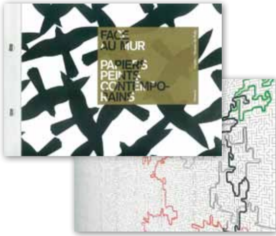
Face au mur. Papiers peints contemporains Infolio, mudac en Musée de Pully, 232 pagina's tweetalig Frans/Engels, 34,35 euro