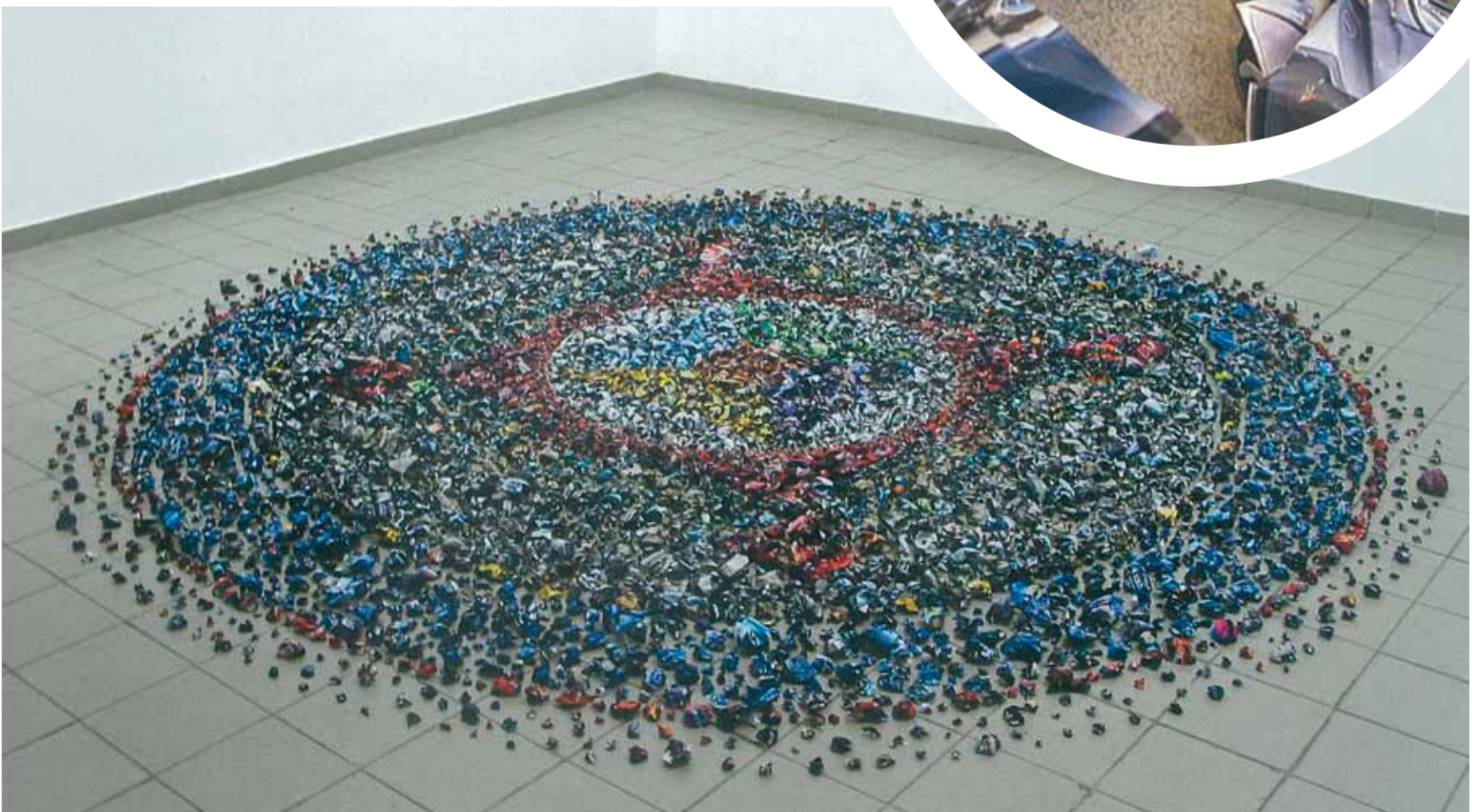
Hendrikje Kühne & Beat Klein, Car Crush , 2007, verfrommelde reclame-illustraties, diameter 500 cm