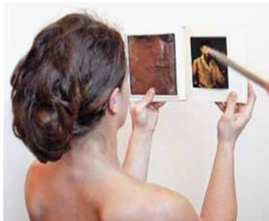
Angel Vergara, Belle Femme au miroir , 2007, videoprojectie en potlood op doek, © Angel Vergara

of zelfs supermarkt, wat aanleiding geeft tot een heel concrete interactie met de consument/toeschouwer. Vergara wil mee bewegen met de wereld en de voeling met de dagelijkse realiteit behouden. Het resultaat is een open, soms nomadisch, maar steeds bewegend en meervormig oeuvre vol verwijzingen naar de