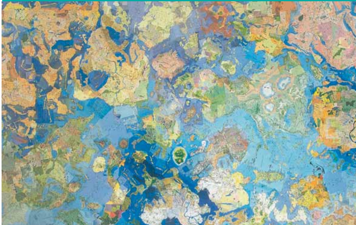
Hendrikje Kühne & Beat Klein, Map of Paradise , 2002, collage van beelden uit reisbrochures, 200 x 360 cm